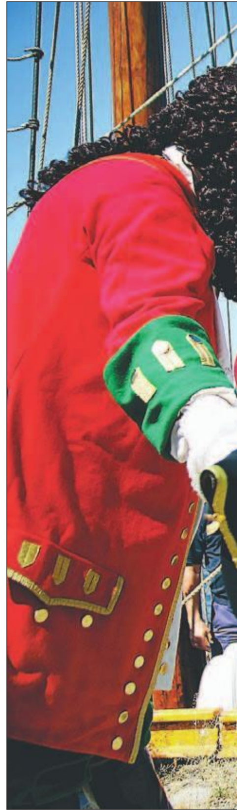
STASELIG ANKOMST Kong Frederik IV i Carl-A

Det var i alle fall ikke særlig stort oppmøte, men noen var det jo og de så ut til å kose seg.