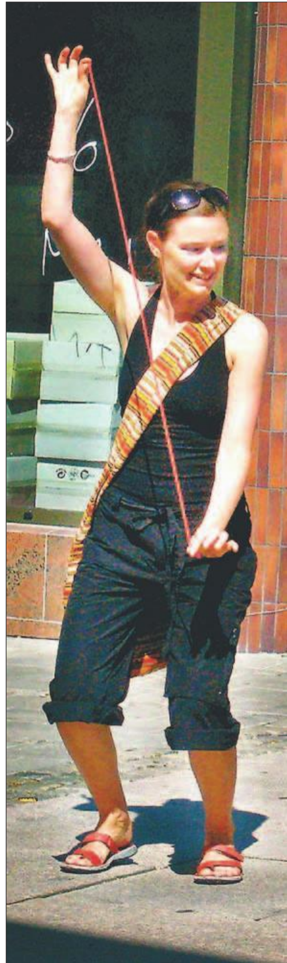
TØFFINGER! Jeg slapp, disse to «mätte». Men så fikk de