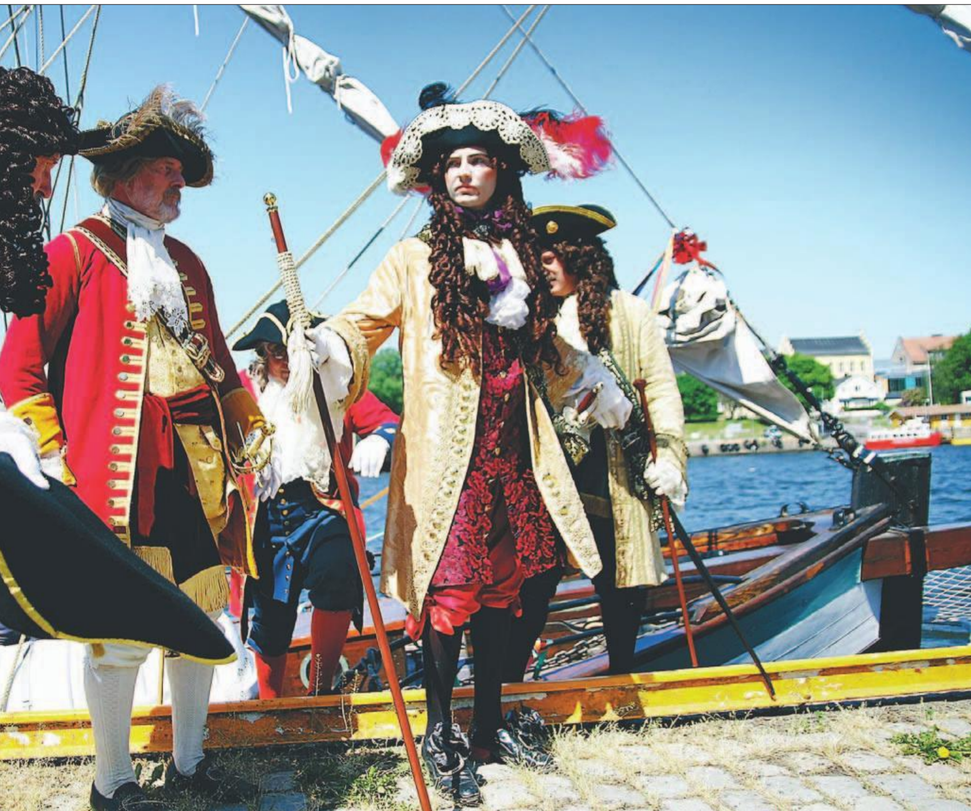
rne Melins skikkelse, hadde staset seg pompøst opp med hvitt pudder i ansiktet og flotte kostymer.