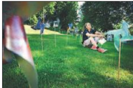
MYE Å OPPLEVE Vindmølleåkeren i Rådhusparken.

gjøres! Så lot heller ikke applausen vente på seg. DEN kan man jo godt tenke seg å bli til del. Til neste år. Eller året etter, da.