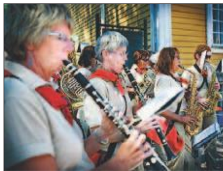
MUSIKK I GATA Lørdag var det musikken som først og fremst var satt i høysetet. Her er Jælpekorpsset i Gamlebyen.