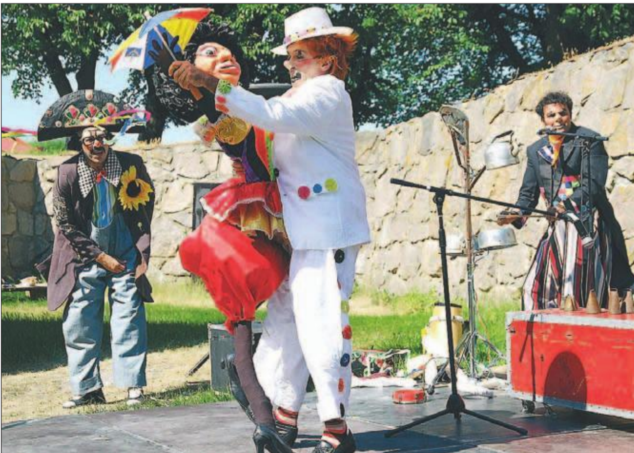
DANS OG MUSIKK Klovnene viste seg fra en musikalsk og underholdende side, da de opptrådte på fortet til glede for både barn og voksne.