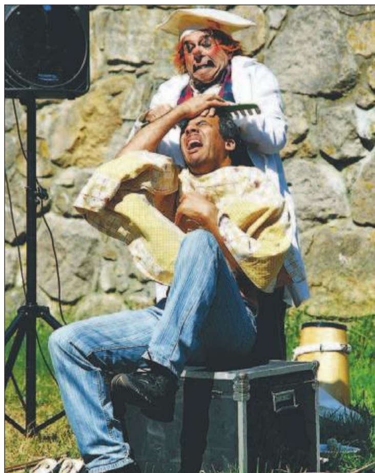
EKTE KLOVNESTREKER Det ble mye barnelatter da klovnene friserte, barberte og klippet hverandre.