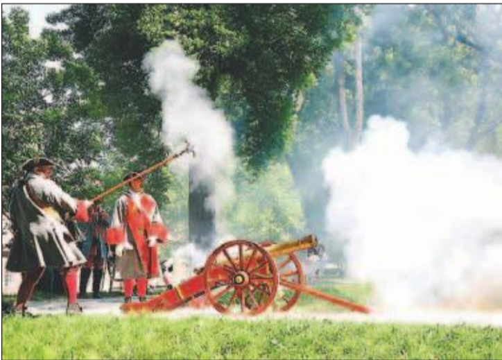
SALUTT Tambourafdeling fyrte av kanoner for å hedre kong Frederik IV.

Nok et år inntok kong Frederik IV festningsbyen, og tryllet den tilbake til 1704.