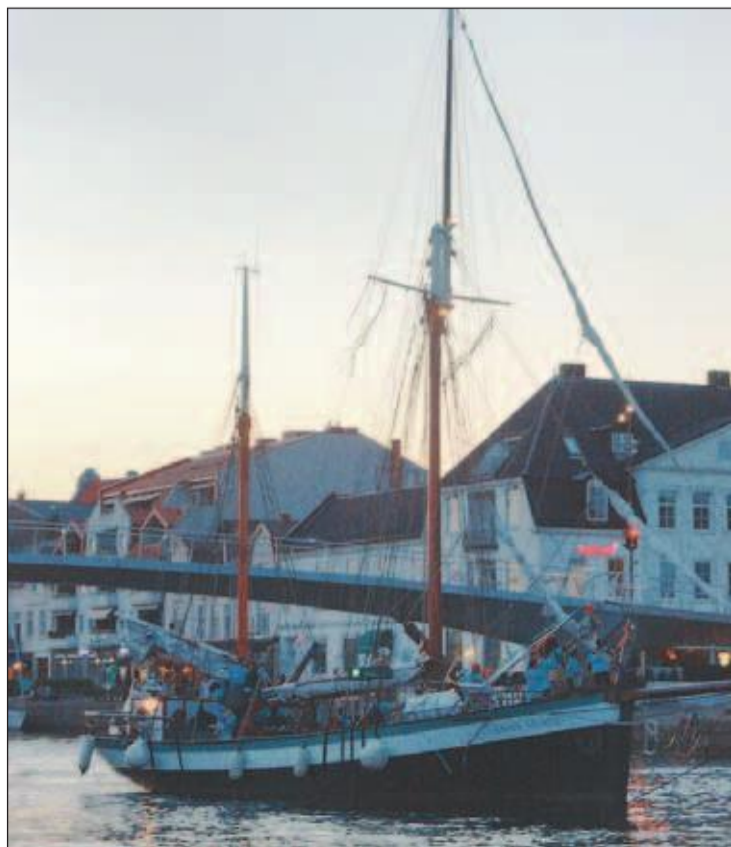
FESTIVALBÅTEN Anna Minde seilet av gårde med artistene oppover elven. De vinket farvel til tilskuerne på land.